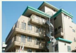
介護老人保健施設 エメロード三萩野